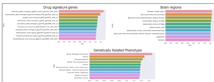
(図表④：デモ画面より) 検索結果に軸を加えて、関連 度合いに応じて表示します。 以下は軸の例： - Drug signature genes - Brain regions - Genetically Related Phenotype

2018年度は、仮説検証結果の表示方法の改善に着手しています。たとえば、検索窓に投入した仮説と類似度の高い文献を表示する標準機能に加えて、仮説内の化合物に反応した遺伝子発現情報を関連度合いに応じて複数の軸で表示することにより、既知の疾病と既知の医薬品による未知の組み合わせに着目してドラッグリポジショニング（医薬品の再活用）研究の検討材料となります。また、ヒトの特定の部位に効果があるとされてきた化合物を別の部位に適用する研究や、特定の遺伝子情報に呼応する化合物の特定などが可能となれば、個別化医療研究に向けた新しいアプローチとなります（図表④）。