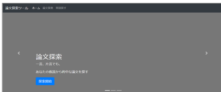
（図表①：デモ画面より） Concept Encoder Articlesの デモ画面のトップページ。

Concept Encoder Articlesは、研究計画立案時に想定した「仮説」そのものを検索窓に入力することで、あらかじめ登録した英文の文献データのなかから仮説に近い文献情報を効率よく探索可能です。研究の初期段階でシミュレーションを重ねて仮説の精度を高めてから研究に着手することにより、研究リソースの最適化につながります。また、自社内に蓄積された実験データや技術情報なども検索対象として登録することにより、自社内のデータの有効活用となるとともに、探索効率の向上が見込めます（図表①②③）。